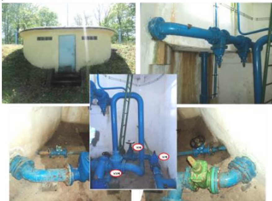
État du réservoir de Varnéville avant travaux

La programmation des travaux sur les ouvrages de Montsec et Boucq vient d'être validée et débutera dès janvier 2019