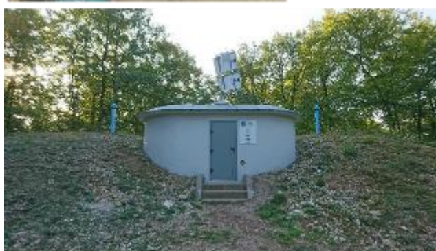
État du réservoir de Varnéville avant travaux